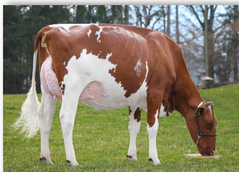
Londaly Crown JELENA VG-87 L1 Ihre DORAL Tochter wird verkauft!