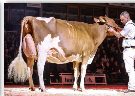
Zingre-Thomi Absolute FLOWER EX-94 Ihre BROKER Tochter wird verkauft!