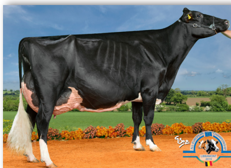
Du Rahun Chelios HELINE EX-95 Ihre HANIKO Enkelin wird verkauft!