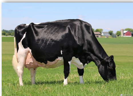
Rosiers Goldwyn BLEXY EX-97 Ihre CRUSHTIME Tochter wird verkauft!

Adresse : Rötelberg 3, 6122 Menznau, Schweiz