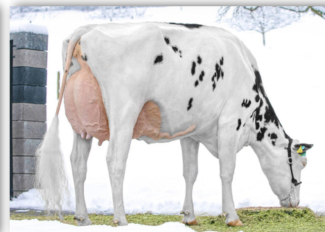
Comestar Doorman O'KATRYSHA EX-93 Ihre DELTA-LAMBDA Tochter wird verkauft!