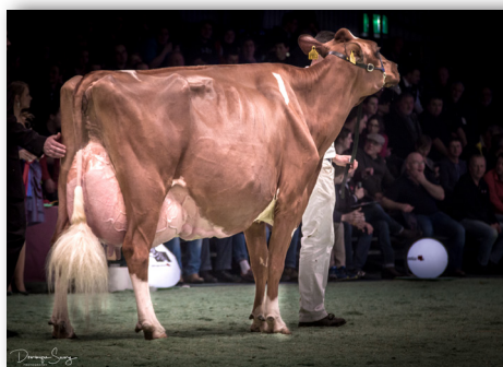
La Waebera Glacier OCEANIE EX-94 Eine POWER aus der Familie von Oceanie wird verkauft!