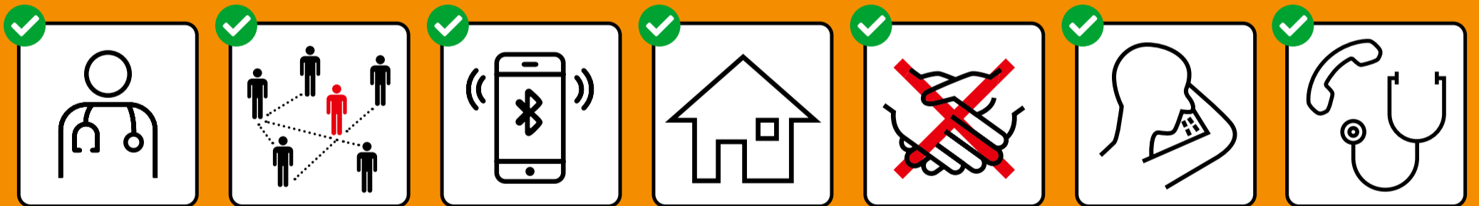
Bei Symptomen sofort testen lassen und zuhause bleiben.