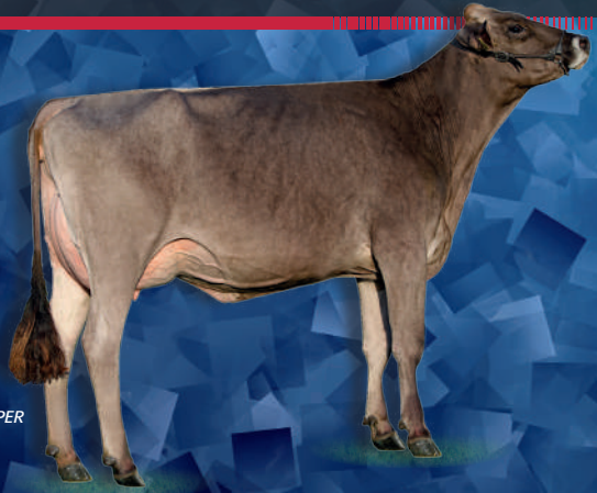
Tellis Pete PIPPER