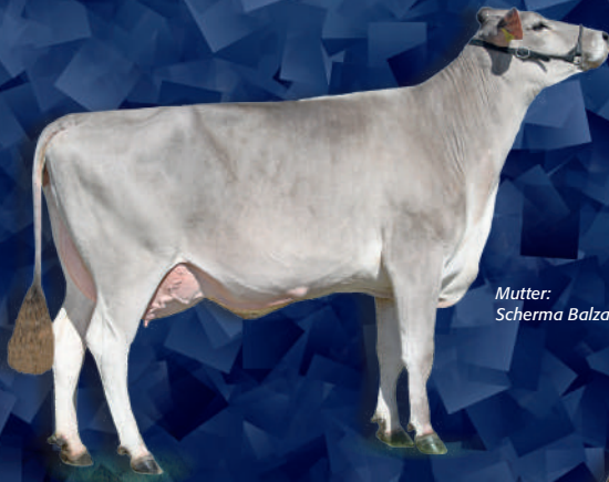
Mutter: Scherma Balzac GRIOTTE